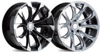
ブラックポリッシュ ハイパーシルバー