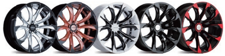
シルバーブラック ブロンズブラック ブラックホワイト ブラック ブラックポリッシュ+レッドクリア