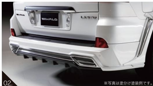
02. ※写真は塗分け塗装例です。