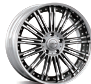
ブラックポリッシュディスク アルマイトリム