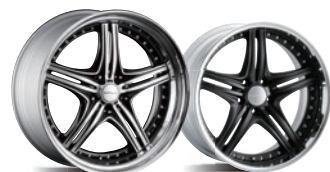
ブラックポリッシュディスク アルマイトリム マットブラックディスク アルマイトリム