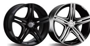
マットブラック ブラックポリッシュ