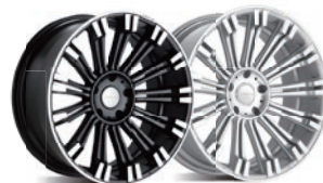
マットブラックポリッシュ シルバーポリッシュ