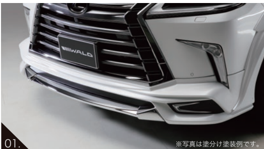
01. ※写真は塗分け塗装例です。